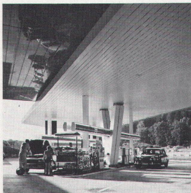
Autobahnrestaurant Würenlos LUXALON ® -Fassadenverkleidung Typ 150 F (als Decke montiert)

LUXALON ® -Aluminiumdecken sind nicht nur die bessere Lösung, sie sehen auch wie die bessere Lösung aus. In Schulen, Bürogebäuden, industriellen Bauten, Krankenhäusern, Supermärkten, Hallenbädern, Hotels, Sportanlagen usw.