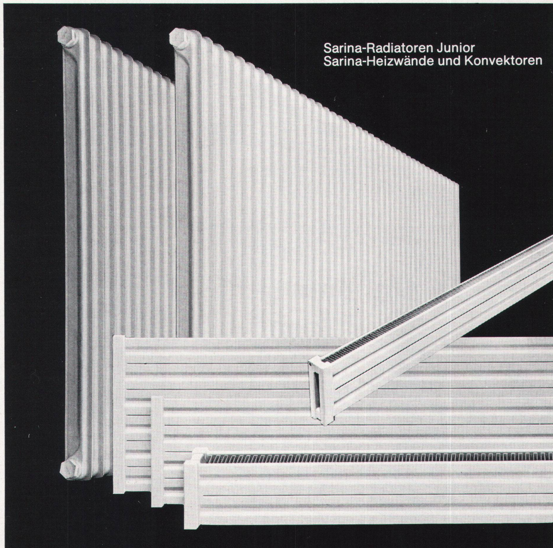
Sarina-Radiatoren Junior Sarina-Heizwände und Konvektoren

Verlangen Sie unser Prospektmaterial oder unseren Vertreterbesuch.