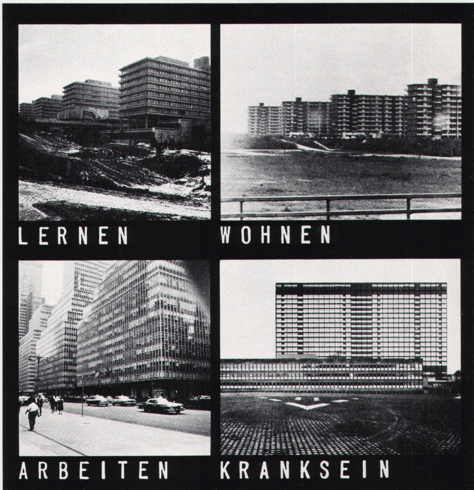
"La destruction de l'environnement par la construction" de Rolf Keller: apprendre, habiter, travailler, être malade, en résumé: mourir

Dernièrement un chef de département d'une grande entreprise de produits synthétiques résolvait ainsi le pro-