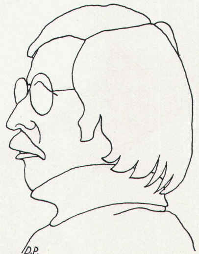
Rolf Keller: Wer es nicht sieht, wie man bauen sollte, muss es sich vom Verhaltensforscher sagen lassen.