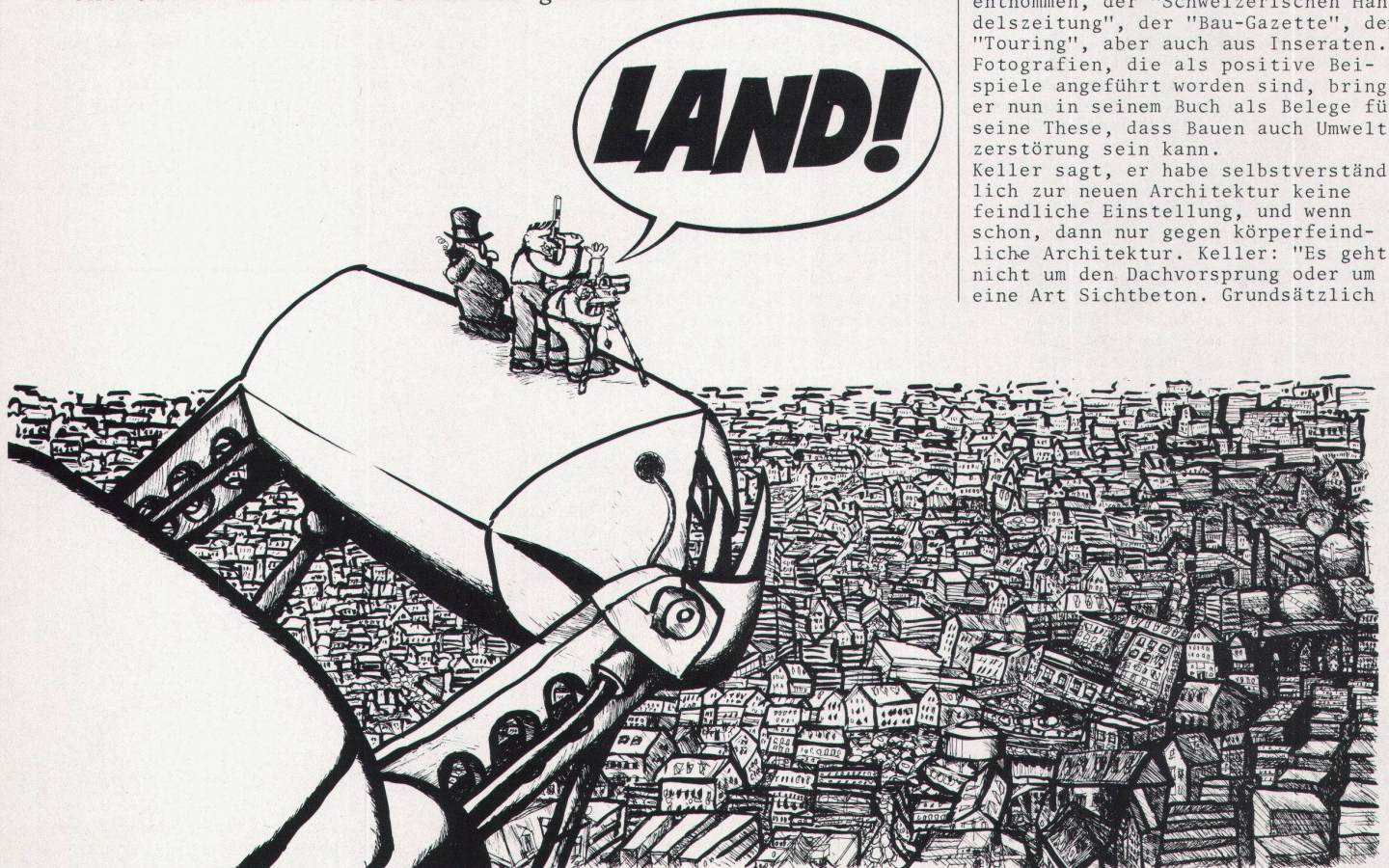
Wie der Zürcher Maler Ueli Bär das Chaos der Agglomeration sieht

Keller sagt, er habe selbstverständlich zur neuen Architektur keine feindliche Einstellung, und wenn schon, dann nur gegen körperfeindliche Architektur. Keller: "Es geht nicht um den Dachvorsprung oder um eine Art Sichtbeton. Grundsätzlich