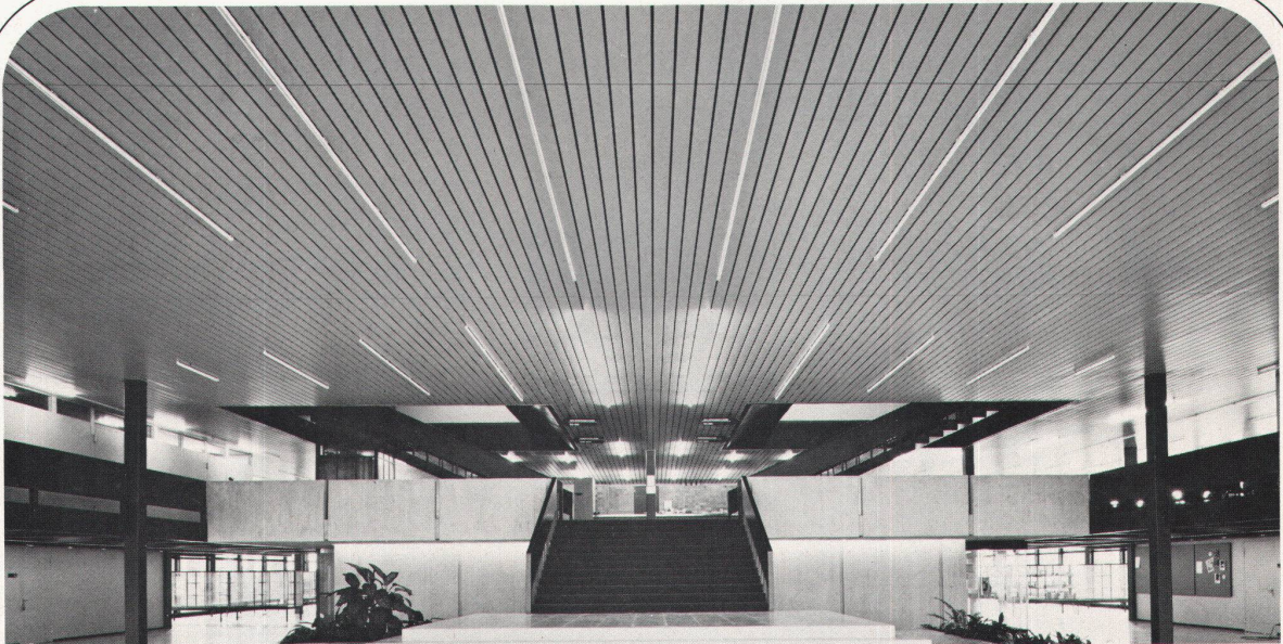
Technikum Rapperswil LUXALON®-Paneeldecke Typ 134 H