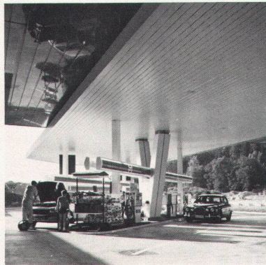
Autobahn-Tankstelle Würenlos LUXALON®-Fassadenverkleidung Typ 150 F (als Decke montiert)

Besser gesagt, weil LUXALON®-Aluminium- decken nur Vorteile bieten: