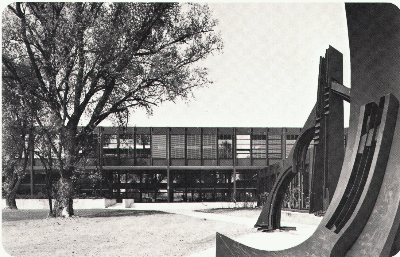
Schulgebäude nach Fertigstellung

Unser Spezialistenteam ist in allen Belangen des Fassadenbaus versiert und stellt Ihnen sein erprobtes Fachwissen gerne zur Verfügung.