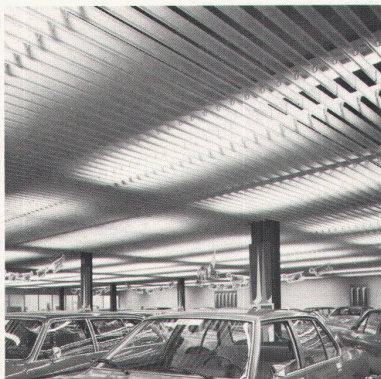
Eulach-Garage Winterthur, LUXALON®-Rasterdecke Typ 100 V