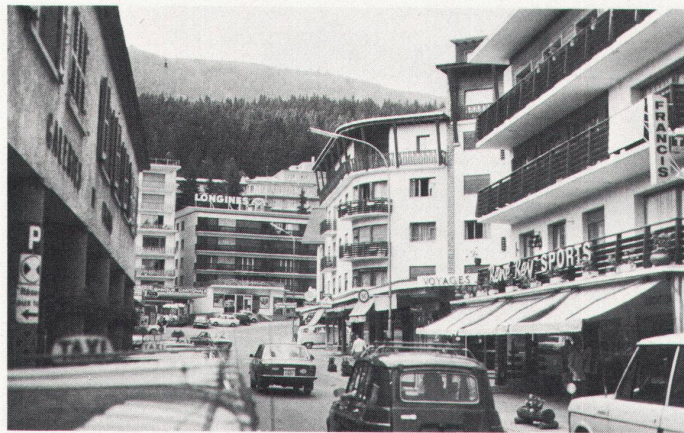
Es war ein schönes Dorf... / Ce fut un joli village...

Wenn einmal der Tourismus als Wirtschaftszweig akzeptiert ist, dann können einige Bedingungen formuliert werden, um seine nützlichen Seiten zu fördern und seine gefährlichen Seiten zu minimieren, so dass er – auch bei Entscheidungen in Unsicherheit – verantwortet werden kann und keine allzu bösen Überraschungen mit sich bringt: