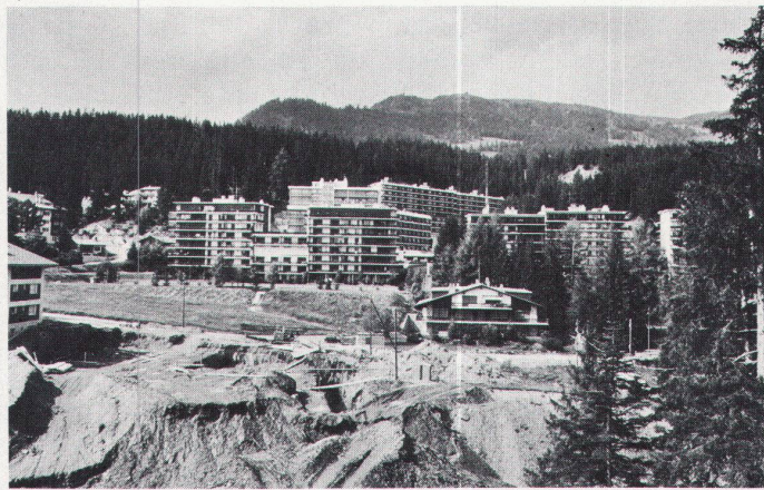
Es war ein schönes Dorf... / Ce fut un joli village...

Le promoteur ne voit le tourisme qu'en chiffres. Pour lui, un dédoublement du tourisme jusqu'en 2000 –