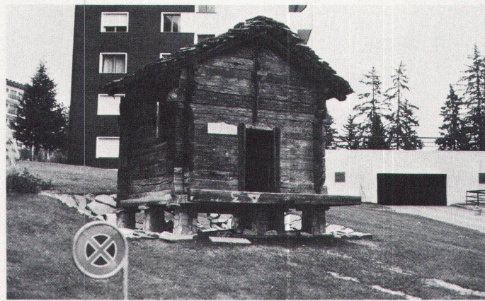
Es war ein schönes Dorf... / Ce fut un joli village...

Private Unternehmer legen ihr Geld offensichtlich am liebsten in lukrativen Transportanlagen oder im Zweitwohnungsbau an – die kurörtlichen Einrichtungen mit