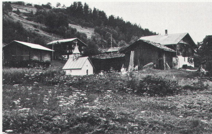
Es ist noch ein hübsches Dorf... / C'est encore un joli village...

Die Einstellung der Politiker, die aus einer «tiefen Überzeugung» – allerdings ohne Quellangaben, wo sie die Überzeugung hernehmen – vom Nutzen des Tourismus spre-