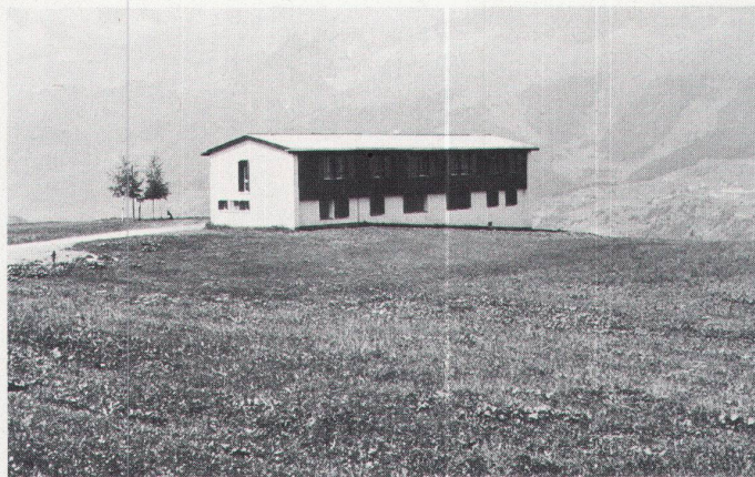
Es ist noch ein hübsches Dorf... / C'est encore un joli village...