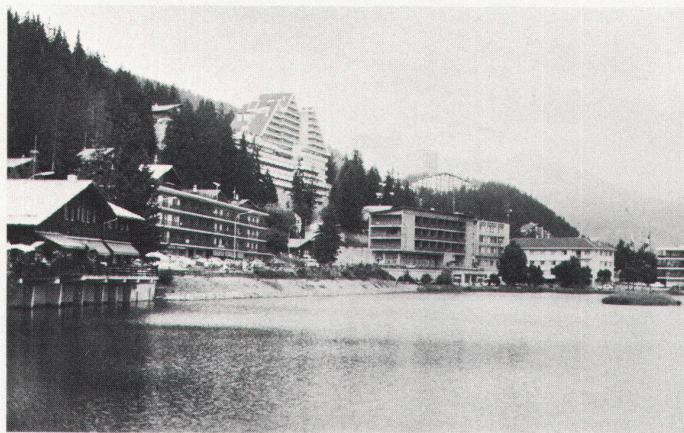
Es war ein schönes Dorf... / Ce fut un joli village...

Die Erwartungen des Gastes sind vielfältig, doch wirken sie sich nicht so direkt auf die Entwicklung des Fremdenverkehrs aus – weil der Fremde in der Gemeinde praktisch nichts zu sagen hat. Erst als Ferienhausbesitzer , wenn er sich einmal etabliert hat, kann er aktiv werden: dann erwacht in ihm oft der Landschaftsschützer, der versucht, weitere Bauten, namentlich in seiner Umgebung, zu verhin-