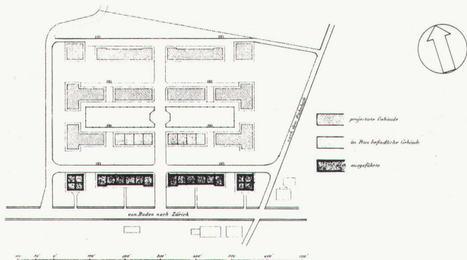
Situation des Gesamtprojektes 1861

Ab 1861 versicherte die Invalidenkasse der Spinnerei- und Weberei- und Webe- reibesitzer die Arbeiterschaft gegen Unfall und vorzeitige Arbeitsunfähigkeit. Die durchschnittlichen Jahresmieten für Wohnungen betragen in der Stadt Fr. 220.– für 3-Zimmer-Wohnungen, Fr. 250.– für 4-Zimmer-Wohnungen; auf dem Land Fr. 130.– für 3-Zimmer-Wohnungen, Fr. 180.– für 4-Zimmer-Wohnungen.