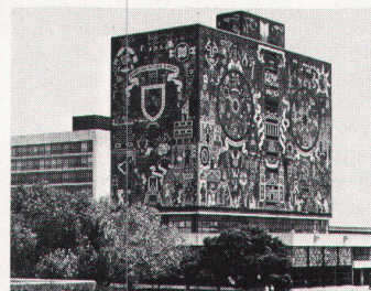
3 Der künstlerische Ausdruck kann den Bau auch schadlos dominieren, wie das Beispiel der berühmten «muralles» der Universität in Mexiko zeigt.

Durch das Fehlen höherer geistiger und ethischer Ideale in unserer Zeit bleibt auch die Kraft zum verbindlichen künstlerischen Ausdruck oft auf der Strecke. Daran würden auch die durch die GSMBA in einem Resolutionsentwurf von der öffentlichen Hand geforderten variablen Baukunstprozente (zwischen 0,5 und 2% der Bausumme als Richtlinie für die gesamte Schweiz) nichts ändern. Eine langsam ins Bewusstsein vordringende Sehnsucht des heutigen Menschen nach «Inhalten» aber, nach einer erlebnisdichteren Umweltgestaltung, die über die reine