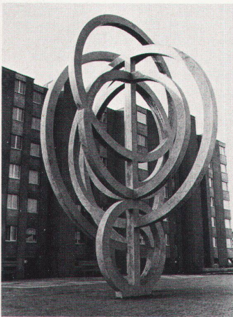
1 Kunst am Bau, wie wir sie nicht mehr wollen: ohne Beziehung steht die Skulptur zur öden Architektur des Mietsblocks da.