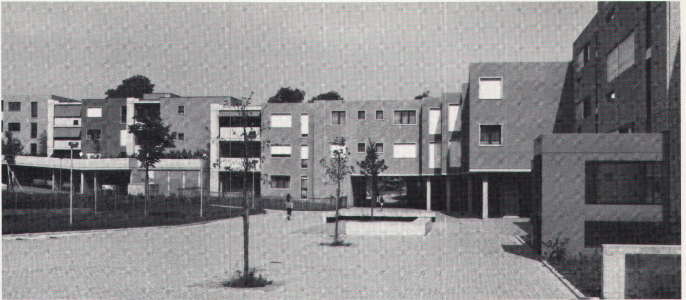
Place d'entrée du quartier