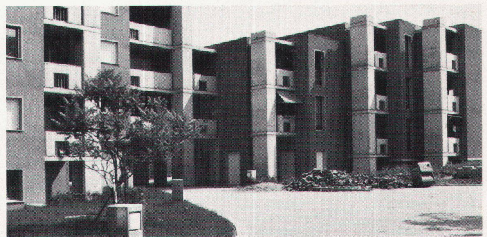
Cour intérieure et passage sous le rez-de-chaussée libre

boratoire, fermée, ou une cuisine ouverte sur le coin à manger ou, encore, une cuisine où l'on peut manger. Un buffet mobile, avec passe-plats et portes sur ses deux faces, permet également plusieurs variantes d'aménagements, au gré du locataire. Sachant combien les enfants sont toujours tentés de grimper sur les fenêtres, l'archi-