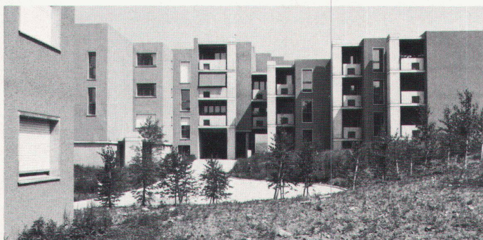
Cour intérieure et cheminement pour piétons