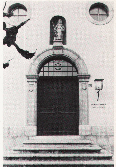
Home de vieillards, Delémont. L'ancienne chapelle a été transformée en bibliothèque des jeunes

werk: Oft wird die Nutzung eines Raumes für andere Zwecke als die vorgesehenen bezweifelt. Meistens ist man voreingenommen, eine bestimmte Nutzung müsste bestimmten Voraussetzungen entsprechen. Für die Veranstalter wäre es interessant, auf der Basis dieses Wettbewerbes Schlussfolgerungen zu ziehen, welche die Verifizierung erlauben würden, inwieweit das gewählte Objekt funktionsgerecht wäre und wie hoch aufgrund der vom Teilnehmer vorgeschlagenen Änderungen die Kosten für