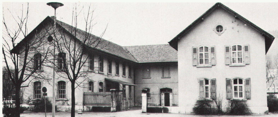
Depuis quelques années les abattoirs de Laufen ne sont utilisés que pendant deux ou trois heures par semaine seulement

werk: Mit der Ausschreibung eines Ideenwettbewerbs zur Nutzung vorhandener Bauten für Freizeit- und Bildungsaktivitäten liefert die Université populaire jurassienne ein wegweisendes Beispiel zur Reform des architektonischen Wettbewerbskonzeptes. Bezweckt dieser Wettbewerb, der regionalen Charakter hat, zugleich auch die Schaffung einer Träger- und Verteilerstruktur der ausgearbeiteten Programme und Beiträge einer Institution im Sinne der Verbreitung kultureller und Bildungsleistungen?