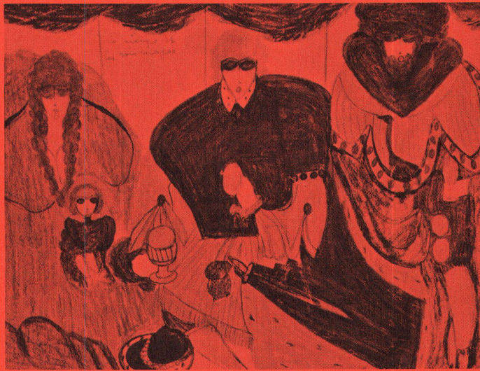
▲ Aloïse, La vierge et les rois mages

Sie fand ihren Ursprung anlässlich einer Reise Dubuffets im Jahre 1945 durch die Schweiz, wo er verschiedene psychiatrische Kliniken und dessen Sammlungen von Werken Geisteskranker besuchte. Er stand damals am Anfang seiner Karriere als informeller Künstler und bemühte sich, eine «Kunst» zu finden, die nicht eine intellektuelle Spielerei darstellen, sondern einem tiefen inneren Bedürfnis sich auszudrücken entsprechen würde. Er bezeichnete diese «Kunst» mit dem Namen «Art brut», um sie bewusst polemisierend der Falschheit der «Art Culturel» entgegenzusetzen. Die Erhebung der «Valeurs Sauvages», das heisst all dessen, was nicht durch die offizielle Kultur berührt wird, stellt den Ursprung seiner Poetik dar, die er in zahlreichen Schriften dargelegt hat und deren Kenntnis unerlässlich zum Verständnis dieser «Collection» ist. Ausser Dubuffet widmete sich der Sammlung