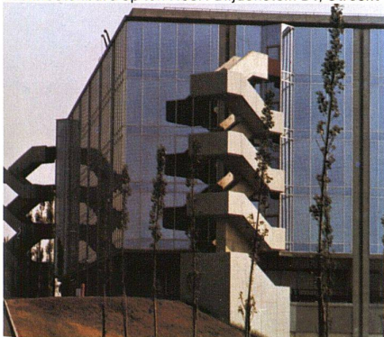
IBM Italia, Milano-Segrate, Italien, 1975 INFRASTOP-Auresin 39/28 Arch. Zanuso, Mailand

tisierten Gebäuden im Sommer entscheidend verringert werden und echte Energie-Einsparung bewirken.