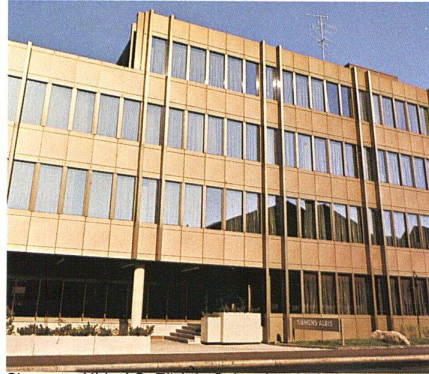
Siemens-Albis AG, Zürich, Schweiz, 1976 INFRASTOP-Auresin 39/28 Generalunternehmung Göhner AG, Zürich

Dank hoher Energie-Rückstrahlung werden je nach Typ 56% bis 85% der anfallenden Sonnenenergie zurückgestrahlt, so dass die erforderlichen Kühlkosten bei vollklima-