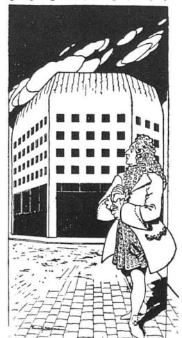
Karikatur aus Der Morgen .