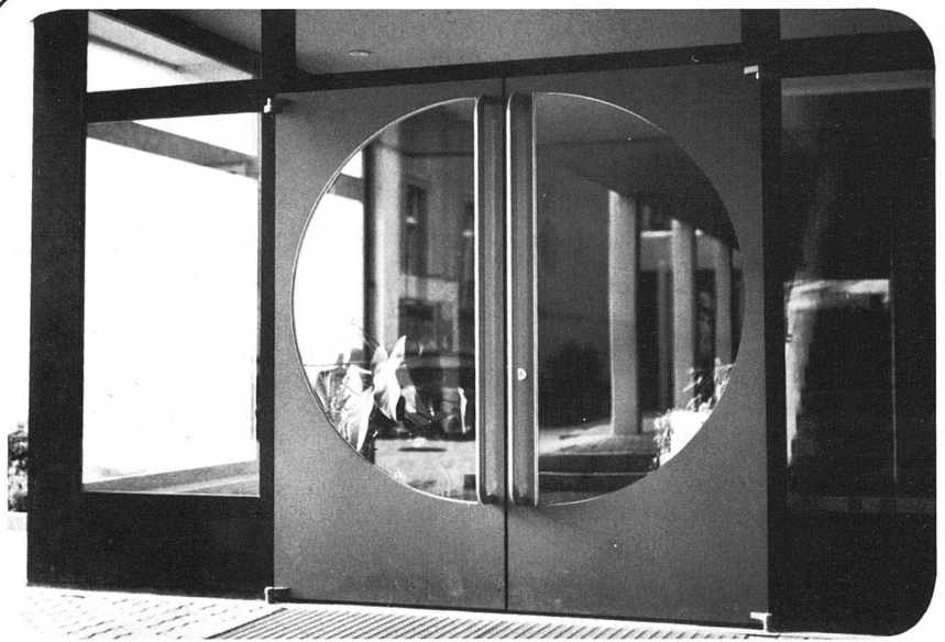
Eingangspartie in Leichtmetall-Konstruktion

Glissa AG Glas- und Metallbau 8200 Schaffhausen Telefon 053 5 92 31 Telex 76347