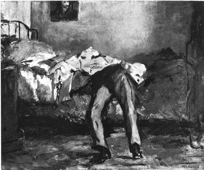
Edouard Manet, Der Selbstmörder , Stiftung Bührlé, Zürich

idee und ihrer Verwirklichung. In weiteren Kapiteln verfolgt Mauner einige dem Einzelwerk übergeordnete Leitmotive Manets wie Unsterblichkeit und Tod. Wie weit Mauner in seinen manchmal etwas kühnen, aber stets einer Beweiskette folgenden