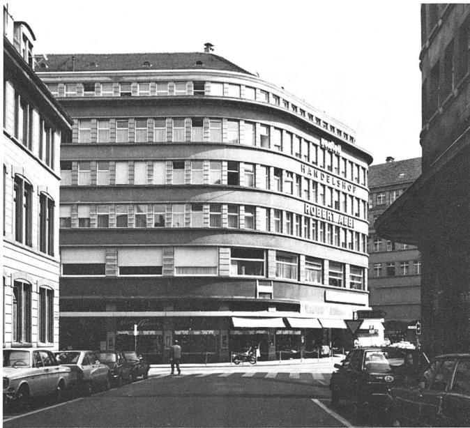
2 Karl Knell, Architekt / architecte: «Handelshof», Sihlporte, Zürich.