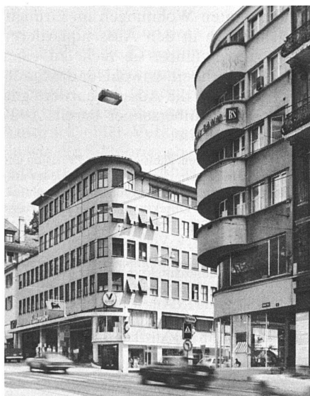
1 Geschäftshäuser in Zürich / immeubles de bureaux à Zurich, Ecke Rämistrasse/Stadelhoferstrasse, 1935 (links) und 1931 (rechts). Architekt / architecte: K. Knell (Bau links) und J. Schlegel & C. D. Burlet (Bau rechts).

«An der Sihlporte, der Stelle, wo die grosse Ausfallstrasse nach Basel den alten Stadtkern verlässt,