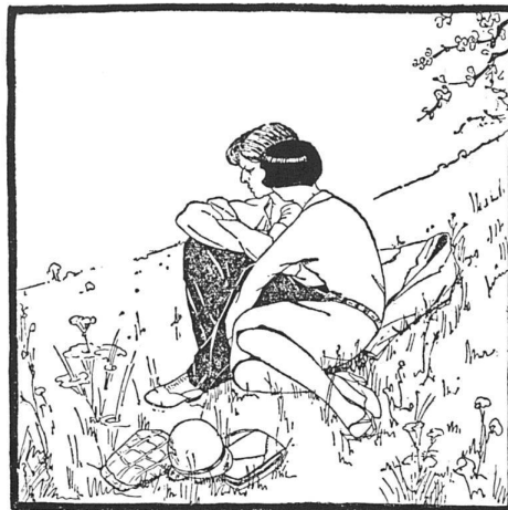
Elle: «Alors quand nous marierons-nous?» Lui: «Quand les loyers baisseront. Au prix où ils sont, il ne resterait pas grand-chose sur ma paie. Se marier pour travailler pour le régisseur, ça ne veut pas la peine.

72 Ein Brautpaar / un couple. Aus/de Le cri du locataire , Genève, Mai, 1929.