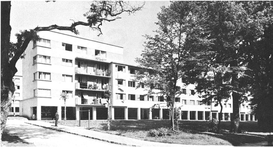
74 Maurice Braillard, Architekt/architecte: Wohnhäuser der Cité Vieusseux / immeubles d'habitation dans la Cité Vieusseux, Genève (1931/32).