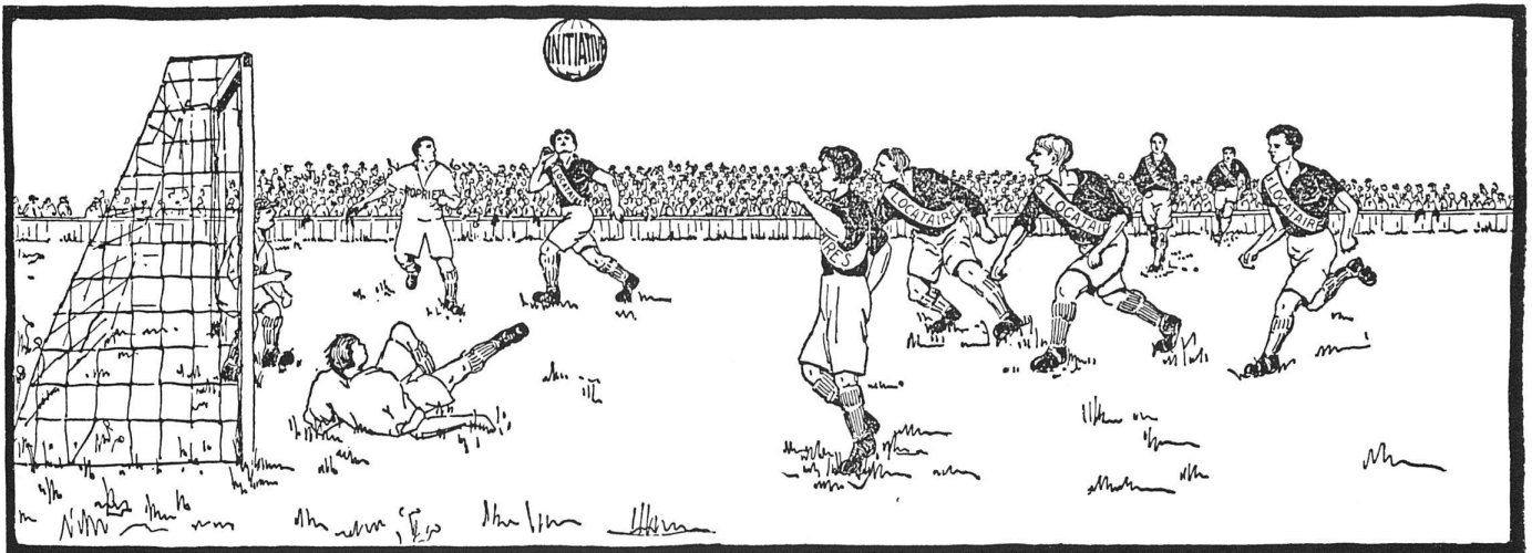
Les locataires marqueront-ils le but de la victoire? Oui, si à la sélection des régisseurs, ils opposent le front unique des locataires.

Votez OUI pour l'initiative populaire des 10.000