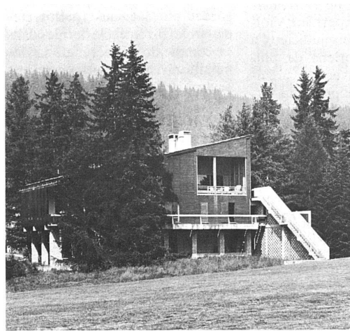
Jacques Favre, villa «Framar» à Montana-Crans VD (1963).