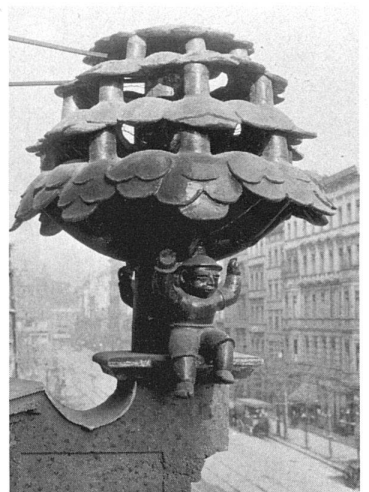
P. R. Henning, Fassadenskulptur an O. R. Salvisbergs Lindenhof, Berlin (1912-13).