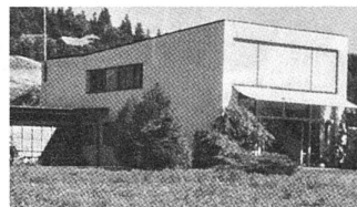
O. H. Senn und W. Senn, Wohnhaus bei Gerzensee BE, 1935