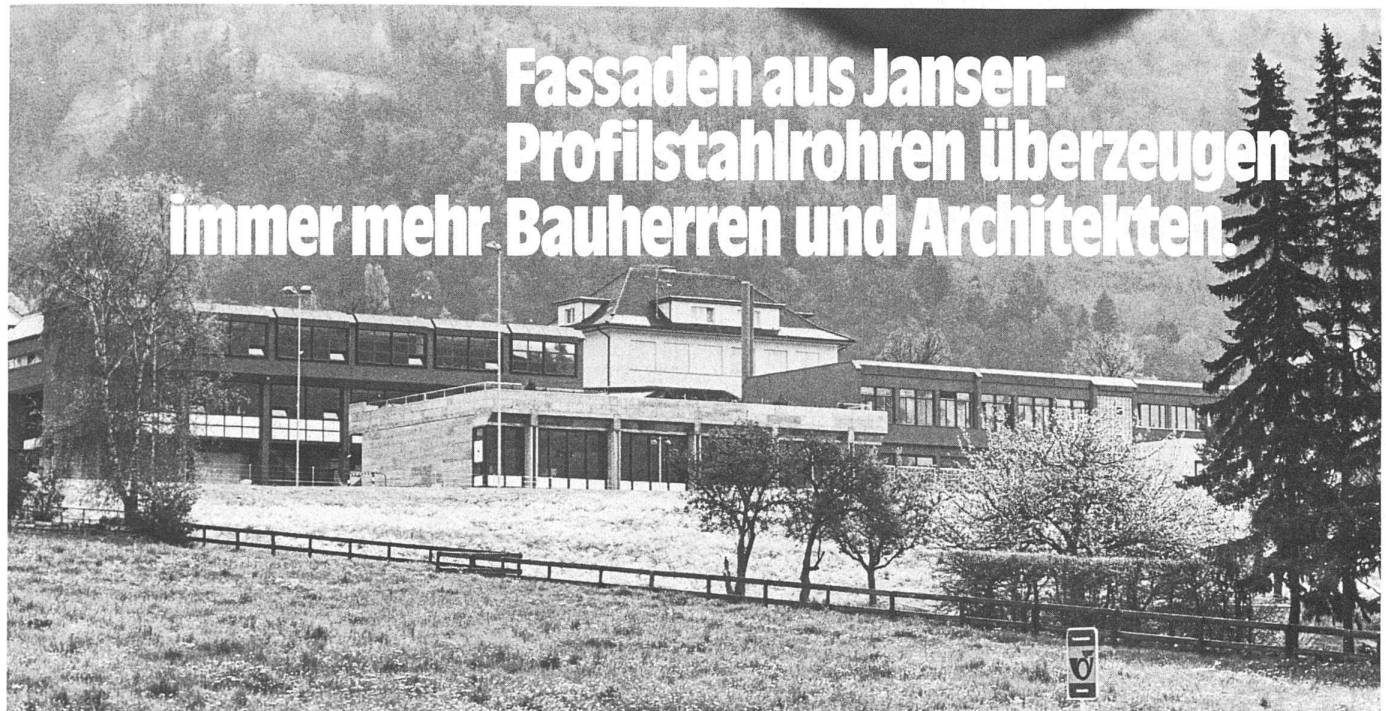
Volksschule Ebenholz, Vaduz FL

Wenden Sie sich an unseren erfahrenen technischen Beratungsdienst.