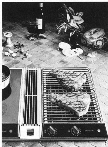
Zum Beispiel: die Barbecue-Kombination