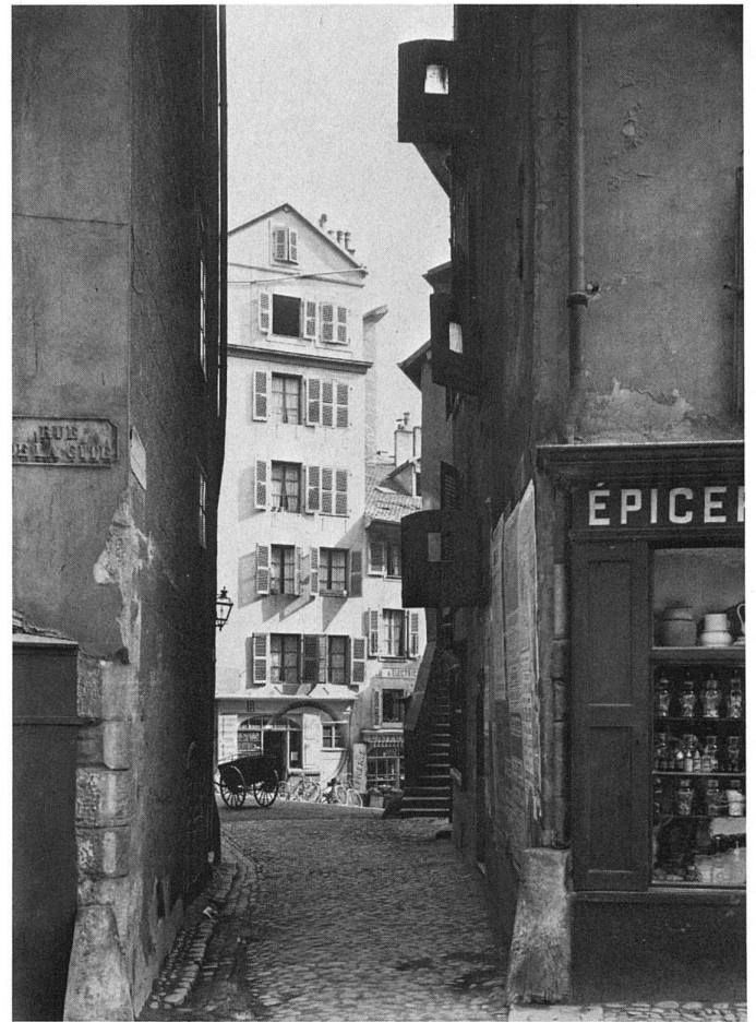
4 Rue de la Cité.

henden Häuser müssen also, falls sie weiterhin rentieren sollen, entweder abgerissen und durch neue ersetzt, oder aber aufgestockt werden. Die Stadtplanung legt somit die Bedingungen fest, unter denen der Grundstückwert gegenüber dem Immobilienwert den Vorrang gewinnt. Das Vorgehen im konkreten Einzelfall kann verschieden sein: Säuberung ist in jedem Falle die Quintessenz von Sanierung. Säuberung der ganzen Parzelle oder Säuberung der inneren Raumunterteilungen oder Säuberung der Dachgeschosse – so oder so: die Renovation ist also eine Funktion der Wertveränderungen im Zusammenhang mit einem bestimmten Baukomplex. Falls diese Wertveränderungen sich nur langsam vollziehen, wird die Stadtsanierung auch nicht zu einem diffusen und kontinuierlichen Phänomen werden; sie bleibt dann mit besonders spektakulären Ereignissen verbunden; auf Paris bezogen: mit dem Bau der Kathedrale, mit der Öffnung der Place Royale, mit der Umgestaltung alter Familiensitze zu eigentlichen Stadtresidenzen, mit dem Durchbruch und der Anlage eines Strassenzuges, mit dem ein Grossherzog oder ein König seinen Namen verewigen will. Renovationen, die sich aus solchen städtebaulichen Unternehmungen ergeben, bleiben Einzelaktionen.