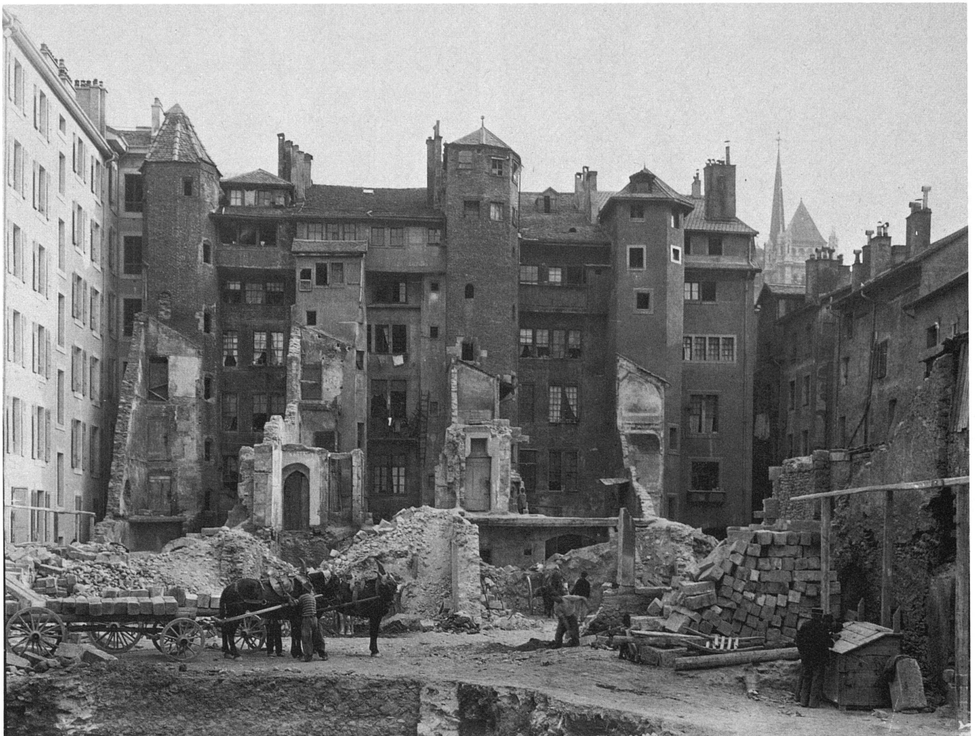
1 Abbruch von Altbauten im Quartier de Rive im Zusammenhang mit dem Strassendurchbruch der Rue de la Tour-Maitresse (um 1897) / Démolition des anciennes maisons du quartier de Rive pour percer la rue de la Tour-Maitresse (vers 1897). Oben rechts die Kathedrale Saint-Pierre; der Backsteinturm links gehört zum mittelalterlichen Palast des Bischofs von Nizza. / En haut à droite l'église Saint-Pierre. La tourelle en brique à gauche faisait partie du palais de l'Evêque de Nice.

«eine grosse Nachfrage nach Wohnungen unmittelbar bevorsteht und nicht dorthin, wo eine solche Nachfrage bereits eingesetzt hat (das Quartier ‚Le Marais‘ ist also nicht mehr aktuell!)».