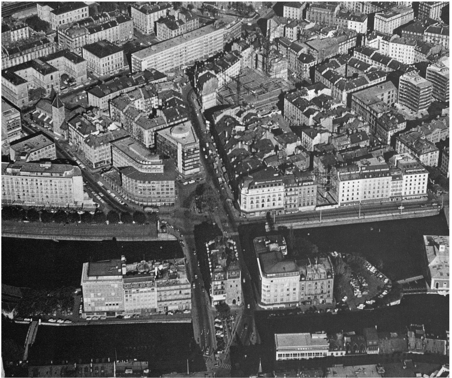
6 Luftaufnahme des rechten Rhoneufers in Genf / Vue aérienne de la rive droite, 1965. / Links aussen das Hotel du Rhône, rechts der Quai des Bergues und dahinter das alte Quartier St-Gervais mit dem Bauplatz des Warenhauses Placette; rechts aussen die zwei Türme der Überbauung Plaza (vgl. auch weiter hinten, pp. 34 f.; pp. 50–56). / Sur le quai à gauche l'Hôtel du Rhône et à droite les bâtiments du Quai des Bergues, derrière lesquels on voit le tissu du quartier St-Gervais, la place Grenus et le chantier du grand magasin de la Placette; à droite les deux tours de l'opération Plaza (voir plus loin, pp. 34 f. et pp. 50–56).

einer neuen, «den Städten des Auslandes vergleichbaren» Stadt. Im Sinne des liberalen «laissez faire» wird die Kontrollfunktion der Behörden auf ein Minimum reduziert.