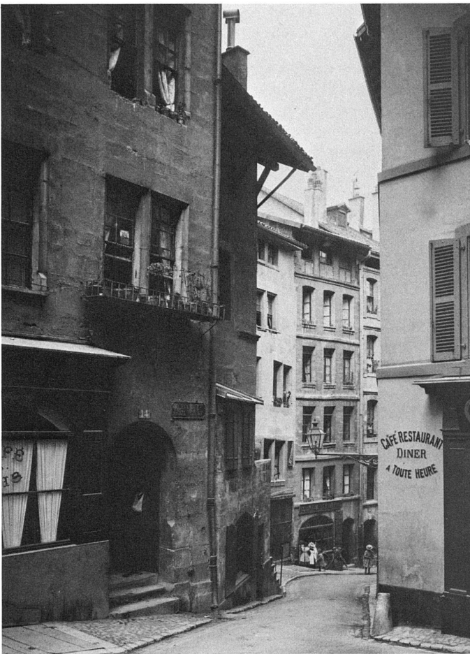
3 Rue du Petit-Perron, in der Altstadt / Rue du Petit-Perron, dans la Vieille Ville.