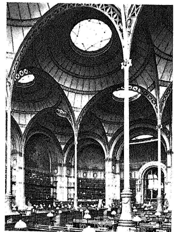
Bibliothèque Nationale, Paris (1854-1875)

Département d'architecture, EPF-L, Avenue de l'Eglise Anglaise 12, Lausanne.