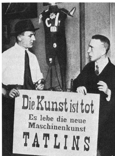
2 John Heartfield und George Grosz auf der ersten internationalen Dada-Messe, Berlin, 1920./ John Heartfield et George Grosz à la première foire internationale Dada, Berlin, 1920.