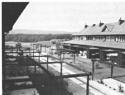
35 Überbauung / ensemble d'habitation Haberacher bei / près de Baden AG (Metron Architekten).