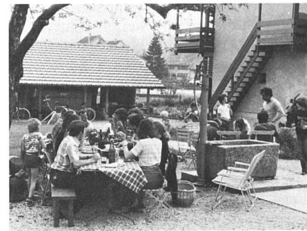
36 Reuss-Siedlung / ensemble d'habitation «Reuss-Siedlung», Unterwindisch, AG (Metron Architekten).