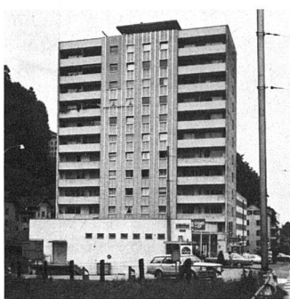
Wohnhochhaus in Luzern während der Sanierungsarbeiten. Die Metallunterkonstruktion «Aluhit-F» ist bereits angebracht, und mit der Montage der Platten wurde oben links begonnen.

Ein interessantes, weil sehr einfaches System, das auch der Preissituation des heutigen Baumarktes gerecht wird, hat die Firma Wyss AG Littau entwickelt und unter dem Namen «Aluhit-F» auf den Markt gebracht. Die Konstruktion besteht aus stranggepresstem Aluminium und überwindet mühelos Wandabstände von 60 mm bis 150 mm. Das Befestigungsmaterial ist rostfrei.