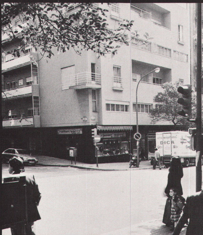
Josep Lluís Sert: Apartmenthaus an der Calle Muntaner (1930–31)/ Immeuble Calle Muntaner (1930–31)