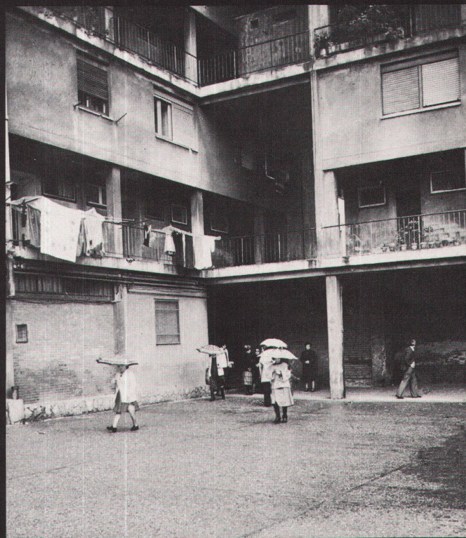
J.L. Sert, J. Torres-Clavé: Sozialwohnungsbau «Casa Bloc» (1932–36)/habitations sociales «Casa Bloc» (1932–36)