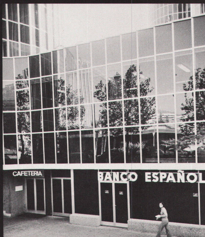
José Antonio Coderch, Manuel Valls Vergés: Bürogebäude «Trade» (1966–69)/Immeuble de bureaux «Trade» (1966–69)