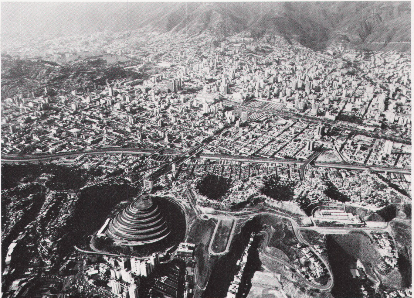
1 Caracas. Vue aérienne vers le nord. En haut, le noyau historique et le centre gouvernemental Simon Bolivar. A l'avant-plan, la «Helicoide»

En 1920 – cent ans après l'indépendance – Caracas comptait