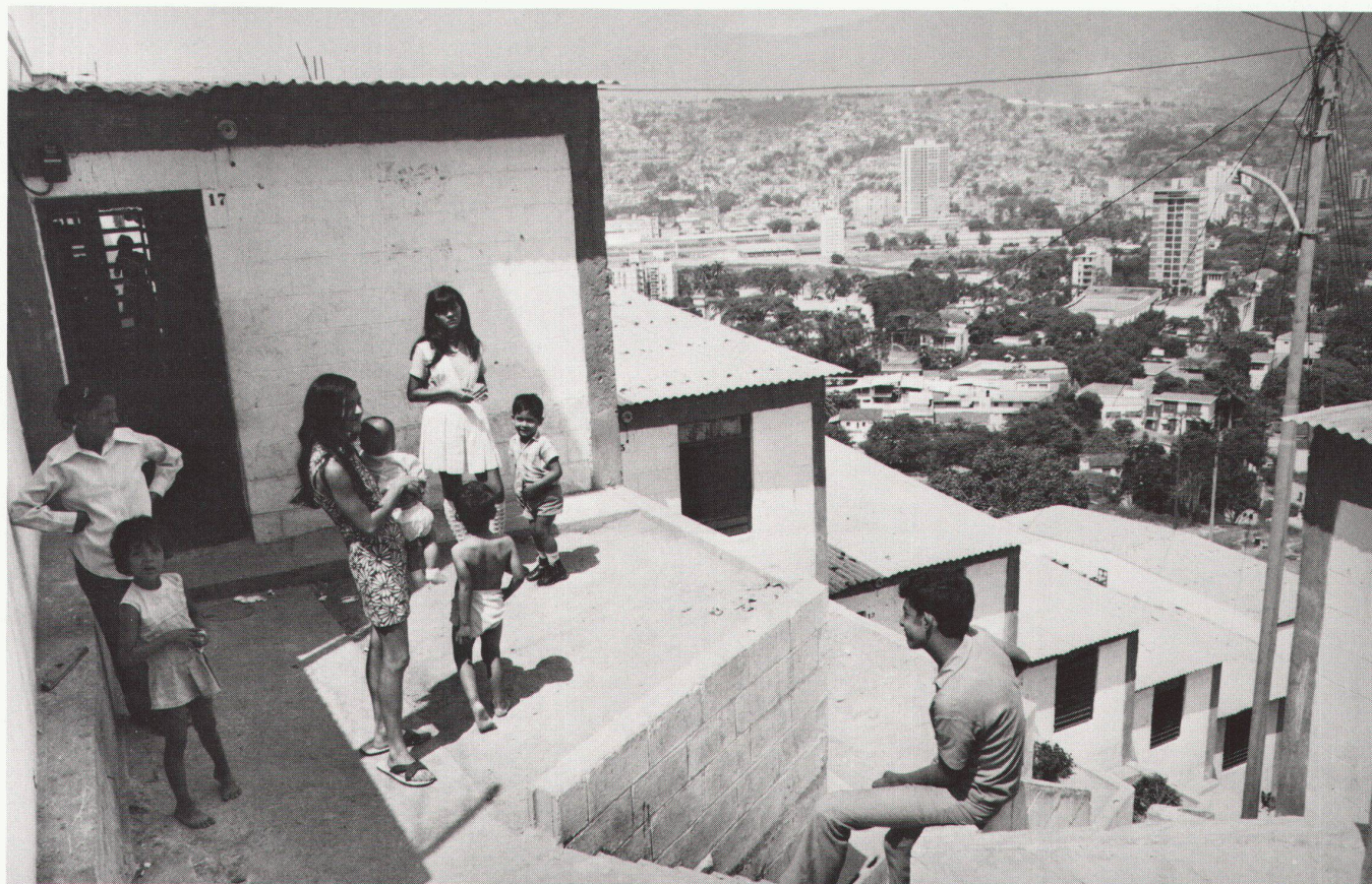
7 Coupe d'un des immeubles-tours du Parque Central. (Architectes: F. Siso et D. Shaw) 8 Logement populaire Banco Obrero en terrasses, achevé

Nulle métropole ne peut fleurir sans une population étrangère résidante. A Caracas, la population cosmopolite joue un rôle dynamique dans la vie culturelle et économique: les architectes du «Parque Central», F. Siso et Daniel Shaw, sont des Espagnols récemment installés à Caracas, et l'architecte de l'Opéra est le jeune architecte allemand D. Kunckel.