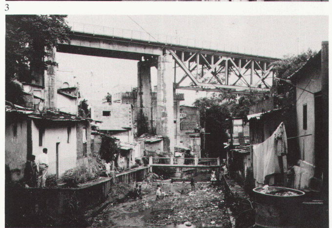
2 Juxtaposition de ranchos et de «superblocs» 3 Ranchos installés dans une «quebrada»

tion qu'avec le «Barbican Development» à Londres. Inséré dans un échangeur d'autoroutes, l'ensemble s'élève sur une plate-forme de six étages de parkings et de magasins d'où surgissent des immeubles d'habitation de 38 étages et des tours de 58 étages contenant des bureaux. Les immeubles sont interliés au sommet par des passerelles volantes di-