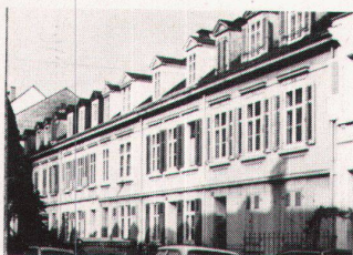
Homburgerstrasse 11–19, erbaut 1892/93 von Fr. Albert. Nr. 19 vom Abbruch bedroht.

in vergangenen Jahrzehnten in Basel an Bausubstanz zerstört wurde; darüber hinaus geht er diesmal einen Schritt weiter, denn er will auch retten, wo noch was zu retten ist, indem er auch schon auf bedrohte Gebäude aufmerksam macht. Der Abreisskalender kostet Fr. 17.– und kann beim Heimatschutz-Kassier, Felix J. Stoll, Oberer Rheinweg 69, 4058 Basel, oder über den Buchhandel bezogen werden.