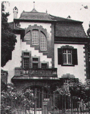
Villa Hirz, bodenweg 95, erbaut 1901 von Suter und Burckhardt. Vom Abbruch bedroht.

Mit Aufnahmen abgebrochener Häuser oder gefährdeter Bauten wirbt der Basler Heimatschutz auch dieses Jahr für die Stärkung des Denkmalschutzgedankens: es wird in Erinnerung gerufen, was