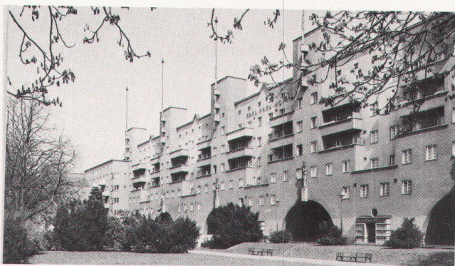
Karl Ehn, Karl-Marx-Hof (1927)

Rund 63 000 kommunale Wohnungen in 379 Grosssiedlungen, versehen mit sozialen Folgeeinrichtungen wie Kindergärten und -krippen, Mütterberatungsstellen, Bibliotheken, Zentralwäschereien und -küchen, Zahnkliniken u.a.m: das ist die gewaltige Leistung, welche die Wiener Stadtverwaltung in der Zeit zwischen den beiden Weltkriegen aufzuweisen hatte. Stelle die bisherige Literatur die politischen, wirtschaftlichen und soziologischen Aspekte in den