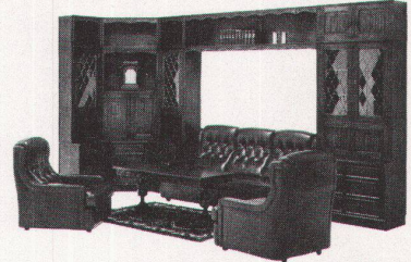
713/ Wohnwand-Programm «Dudor» für Wohn-, Ess- und Arbeitszimmer Eiche massiv, antik behandelt. Wie Bild. Lieferpreis: 8405.- Abholpreis: 7805.-