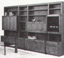
221/342 Wohnwand-Kombination Eiche, Farbe rustikal Scheiter/Baum mit Licht, Rauchglasstirn Lieferpreis: 4417.- Abholpreis: 4065.-