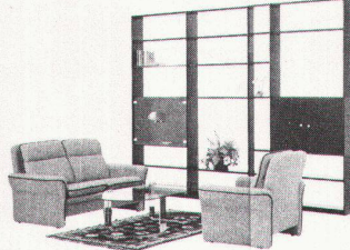
525/ Element-Wohnwandprogramm Eiche. Unzählige Variationsmöglichkeiten in verschiedenen Farben, z.B. wie Bild Lieferpreis: 2957.- Abholpreis: 2721.-