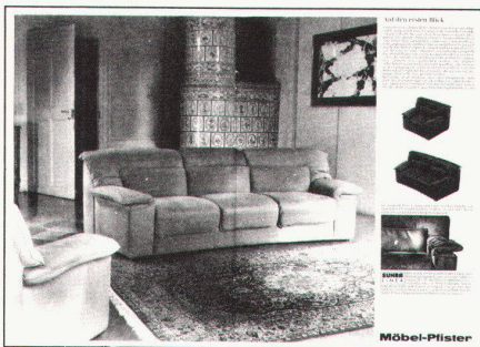
4 SUHRA-Linea-Klubsessel-Sortiment (Möbel-Pfister-Insertat im Tages Anzeiger Magazin Nr.42/1978)/SUHRA-Linea Collection de fauteuils (Annonce dans le Tages Anzeiger Magazin No 42/1978).

«Nach dem Essen nimmt man die Gläser mit ins Wohnzimmer. Man lauscht der Stille und später einer Platte, als höre man beides zum erstenmal. Endlich findet man Zeit, in dem Buch zu lesen, das