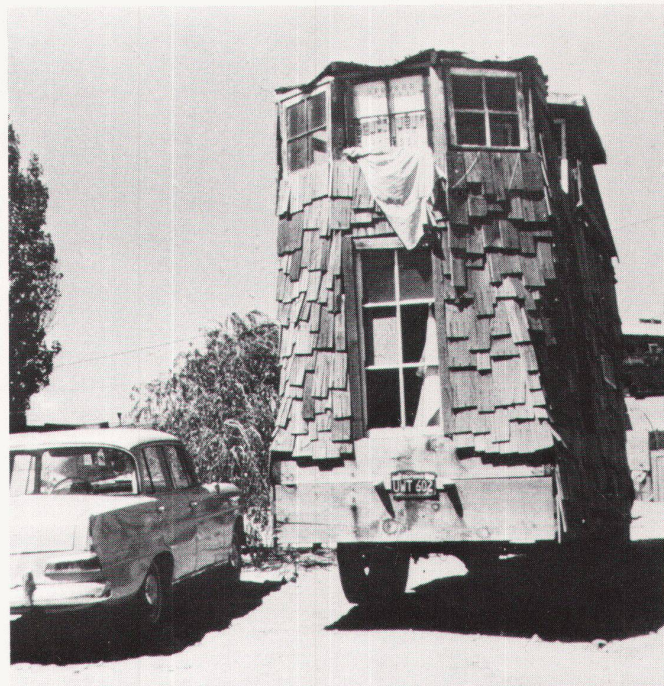
17 Maisons-automobiles. Automobilhäuser.

Le manifeste correspond à la recherche d'un mode de vie différent; d'un comportement vis-à-vis de la société, de la production, du travail et du plaisir; enfin, d'un rapport nouveau des individus