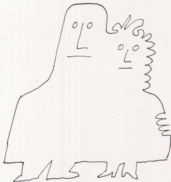
47 Zeichnung aus Steinberg's Paperback (Rowohlt Verlag, Reinbek 1964)