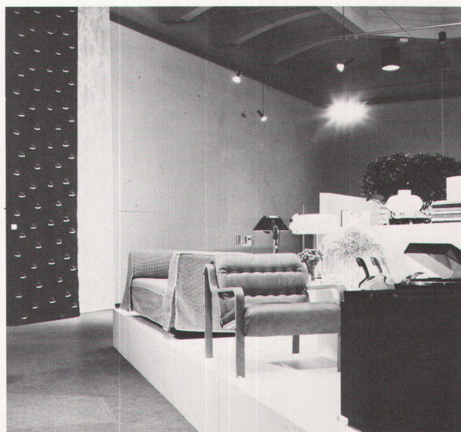
49 a, b «Design aus Schweden»/«Design de Suède»