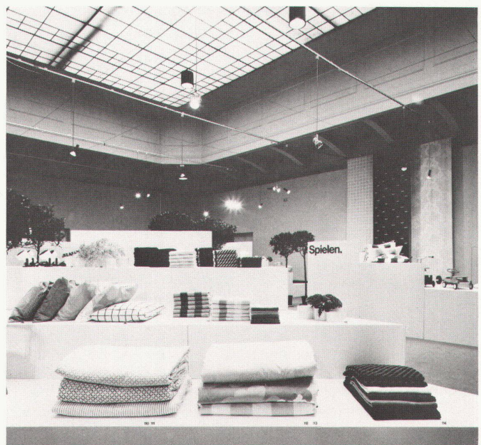
48a, b «Design aus Schweden». Ausstellung im Museum für Angewandte Kunst, Wien; Frühjahr 1979 / «Design de Suède». Exposition dans le Museum für Angewandte Kunst, Vienne; printemps 1979.