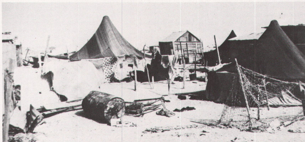
52 Rosso; vue du village / Rosso; Blick auf das Dorfzentrum.

Les Ateliers firent un recensement de toutes les tentes et bara-