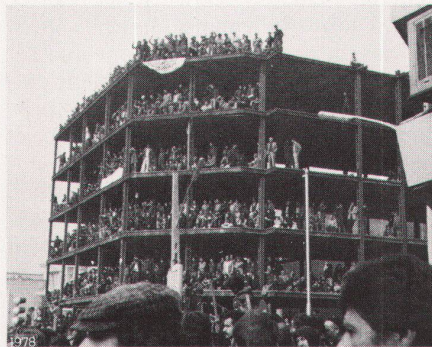
22 Téhéran: Décembre 1978 / Teheran: Dezember 1978.

La réflexion sur le phénomène est fondamentale pour nous, techniciens, spécialistes ou autres «experts» de la construction et de l'aménagement. Le champ de nos interventions, lié à l'aménagement concret de l'espace et du temps, tient, sans en être un élément déterminant, un rôle néanmoins important dans le cadre culturel, politique et économique d'une formation sociale, dans un pays du troisième monde comme, en définitive, dans un pays du monde industrialisé.