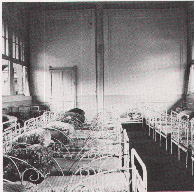
70 Hsi-shi Hofhaus in Peking, heute Kindergarten. / Maison Hsi-shi sur cour à Pékin, actuellement jardin d'enfants. 71 Hsi-shi Hofhaus; quadratischer Hof als Spielfläche. / Maison Hsi-shi sur cour; cour carrée servant de place de jeu. 72 Hsi-shi Hofhaus; Wandelgalerie mit Hof. / Maison sur cour Hsi-shi; ambuloire et cour. 73 Hsi-shi Hofhaus; Schlafraum im Mittelgebäude. / Maison sur cour Hsi-shi; dortoir dans le bâtiment central.

chinesische Pavillon-Architektur. Auf der zweiten Reise 1978 befasste ich mich vor allem mit Hofhäusern. Bedeutende Architekten unserer Zeit haben mich ermutigt, das Gesehene in einem Bildband und in einer Wanderausstellung unter dem Titel der klassischen Hofhaus-Architektur zu veröffentlichen. Ich durfte sogar nach meinem eigenen Pro-