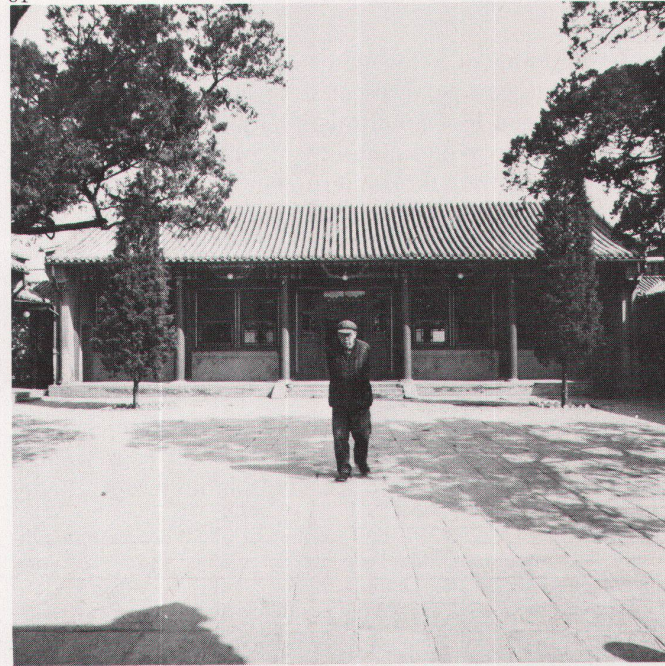
78 Hofgemeinschaft an der Ni-shi-Allee in Peking. Wohn- und Schlafraum mit traditionellem Bilderschmuck. / Communauté de cour sur l'allée Ni-shi à Pékin. Pièce d'habitation et chambre à coucher avec décor traditionnel. 79 Volkskommune «Roter Stern» bei Peking (Baujahr 1977). / La Commune de «l'Etoile Rouge» près de Pékin (construite en 1977). 80 Szechuan Restaurant in Peking. Eingangspartie mit grossem Vorplatz. / Restaurant Szechouan à Pékin. Entrée avec grande place. 81 Innenhof mit nach Süden gerichtetem Hauptbau. / Cour intérieure avec le bâtiment principal orienté vers le sud.

und verlangen natürlich ein grosses gegenseitiges Entgegenkommen. Über Jahrhunderte haben die Chinesen ein reibungsloses Zusammenleben grösserer Bevölkerungsmassen auf engstem Raume vordemonstriert. Durch den enormen Bevölkerungszuwachs wird die innerstädtische Wohnform der Hofhäuser durch