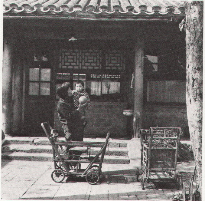
74 Kindertagesheim an der Volksstrasse in Peking. Haupteingang an der Erschliessungsstrasse. / Crèche d'enfants à la rue du Peuple à Pékin. Entrée principale sur la voie d'accès. 75 Kindertagesheim. Hoffläche für Gruppenspiele. / Crèche d'enfants. Cour servant aux jeux de groupe. 76 Hofgemeinschaft an der Jia-dao-Ku-Allee in Peking; Aussenmuer mit Steinwand im Innern. / Communauté de cour à l'allée Jia-dao-Kou à Pékin; mur extérieur avec paroi de pierre à l'intérieur. 77 Hofgemeinschaft an der Nian-Zi-Allee in Peking. Der Standard-Kinderwagen in Bambus erfüllt mehrere Funktionen: Liegen und Sitzen für 1–2 Kinder, überdies kleine häusliche Transporte. / Communauté de cour sur l'allée Nian-Zi à Pékin. La poussette en bambou standard offre plusieurs possibilités: 1–2 enfants assis ou couchés, et elle sert aussi de chariot pour petits transports ménagers.

strassen her im Abstand von ca. 60–70 m stellt einen idealen Grundraster für die Ent- und Versorgung der Wohneinheiten dar. Der Siedlungstyp enthält einen vielfach räumlich differenzierten Ausbau: vom Hofstyp mit nur einem Haus bis zu mehrhöfi-