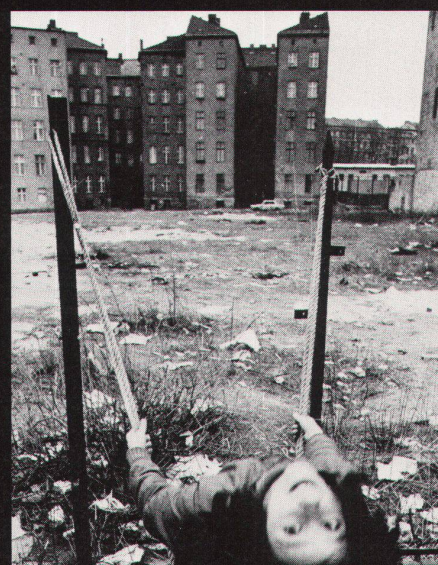
135 Abriss Häuser und halbe Höfe in Schöneberg / îlots insalubres et demi-cours à Schöneberg