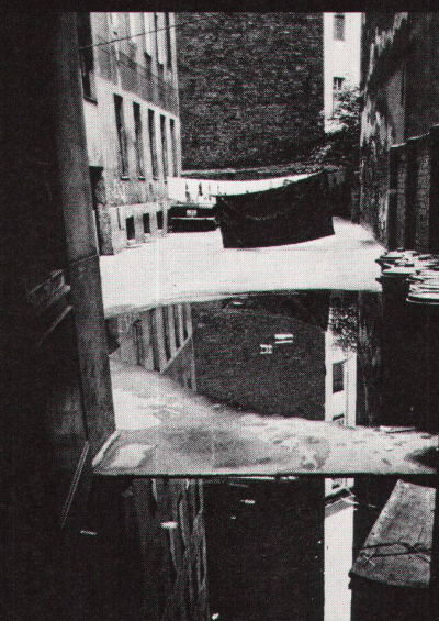
134 Wohnhof in Kreuzberg / cour habitée à Kreuzberg