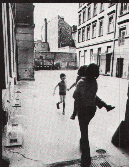
133 Hofbewohner / habitants de bloc

Diese langsamen Veränderungen bestimmen das zweite Gesicht der Stadt – es ist die Stille der Höfe oder der Arbeitslärm; es ist das stets wiederentdeckte unbekannte Leben einer Stadt.