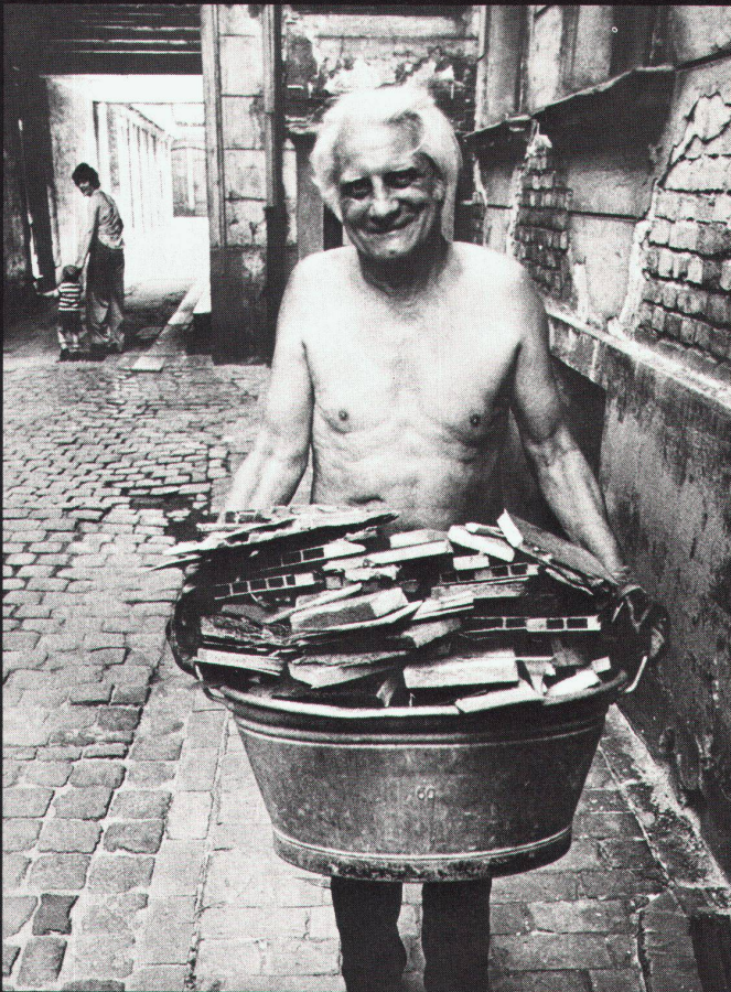
137 Wohnen und Gewerbe in der Oranienstrasse / habitat et commerce dans la Oranienstrasse