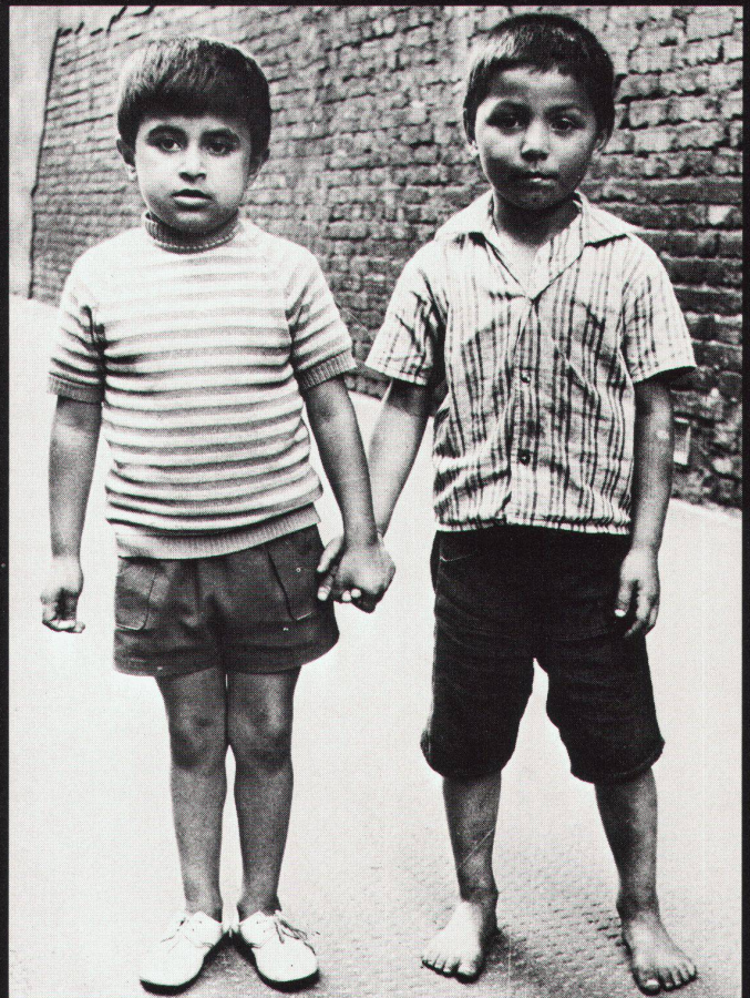
138 Hofbewohner / habitants de bloc