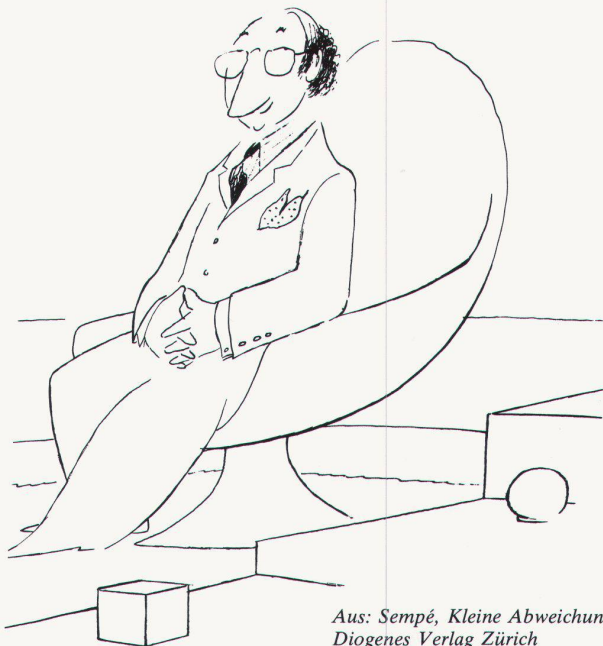
Aus: Sempé, Kleine Abweichung, Diogenes Verlag Zürich

Tragisch ist, dass die gute Form mit Unterstützung von offensichtlich verwirrten Intellektuellen als Symbol für eine allgemeine