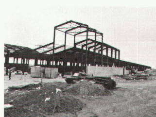
Suter & Suter, architectes, Bâle: une usine de câbles en Iran; état présent

Comme l'article paru dans werk·archithèse concernant l'EPF-L ne fait pas mention des enseignements touchant aux relations Suisse/Tiers Monde et ne renseigne pas sur les efforts d'ensemble de l'EPF-L pour une plus grande ouverture vers les pays en voie de développement 1 , il me paraît indispensable de fournir à vos