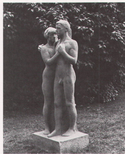
Otto Roos: Zwei Menschen, 1916. Sandstein, Kunstmuseum Basel