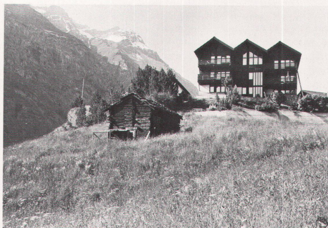
3 Haus Palma in Zermatt während des Baus. Vom Massivsockel bis zu den Pfetten durchlaufende Zangenstützen und Riegel in 2,75-Träger-Abstand, darauf Balken- respektive Sparrenlage als Primärkonstruktion Maison Palma à Zermatt pendant la construction. Supports de poutres traversières qui sont continus depuis le socle jusqu'aux pannes, et traverses dans un écartement de 2,75, par-dessus, respectivement poutrage et chevronnage en

tant que construction primaire Palma house in Zermatt while under construction. From the foundation up to the rafters continuous waling supports and timbers with support interval of 2.75 m. above, beams or rafters as primary construction