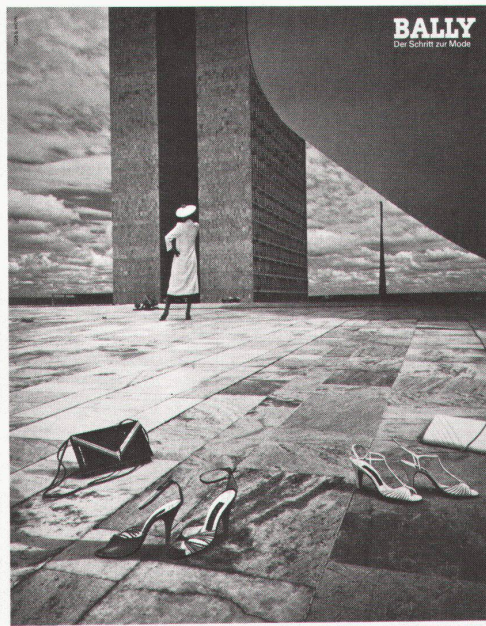
Machen Sie eine Entdeckung in die Kleiderjahre. Die neuen Schuhe sind die mit schmalen Absätzen und raffiniert geformtem Bridenschuh.