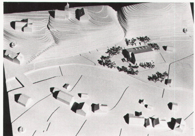
1. Preis, Turnhalle Stein/Toggenburg