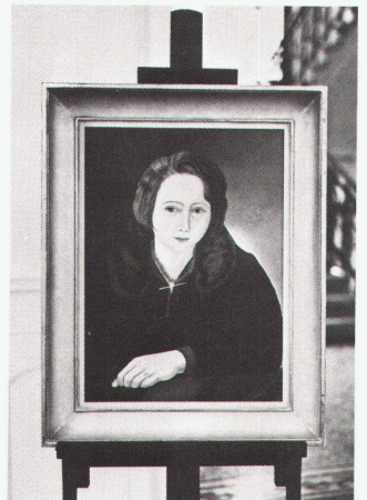
Adolf Dietrich: Dame mit roter Koralle