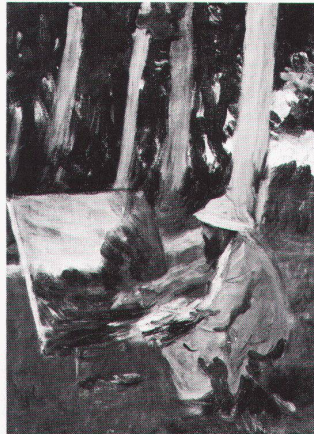
John Singer Sargent: Claude Monet Painting at the Edge of a Wood