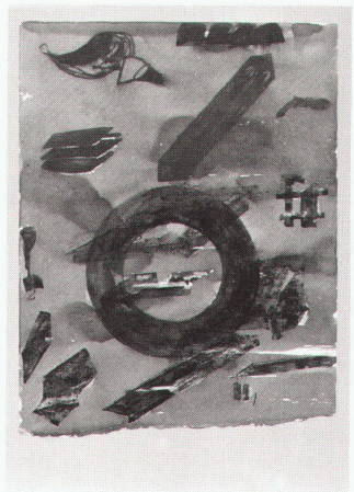
Joseph Beuys Sculptures 1964

Islamische Kunst im 16. und 17. Jahrhundert bis 15.1.84 Zeichnungen von Raffael aus britischen Sammlungen bis 15.1.84