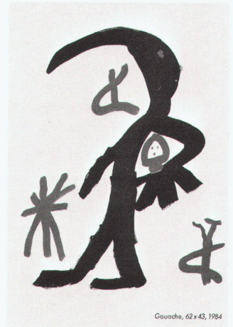
Gouache, 62 x 43, 1984