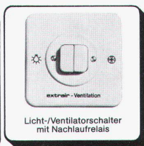
Licht-/Ventilatorschalter mit Nachlaufrelais