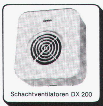
Schachtventilatoren DX 200