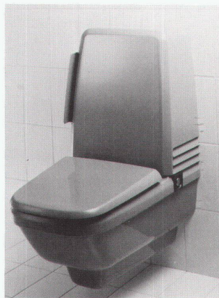
Die neue WC-Generation: Propomat von Geberit mit Warmwasserdusche, Fön und Geruchvernichter, ausgezeichnet mit dem Preis für gute Gestaltung «design '85 stuttgart».