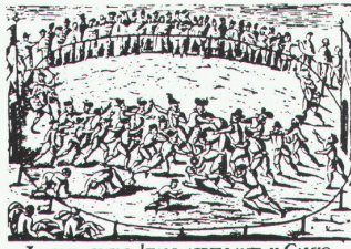
LVDVS QVEM ITALI APPELLANT IL CALGIO