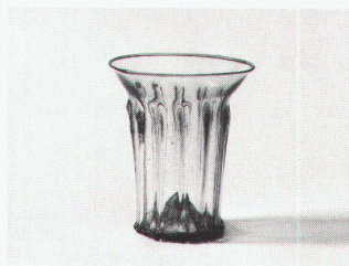
Rippenbecher aus farblosem Glas mit blauem Randfaden, 13. und frühes 14. Jahrhundert

Phönix aus Sand und Asche – Glas des Mittelalters 21.4.–24.7.